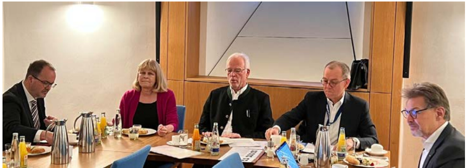
Die Vizepräsidenten zu Besuch bei der SPD.