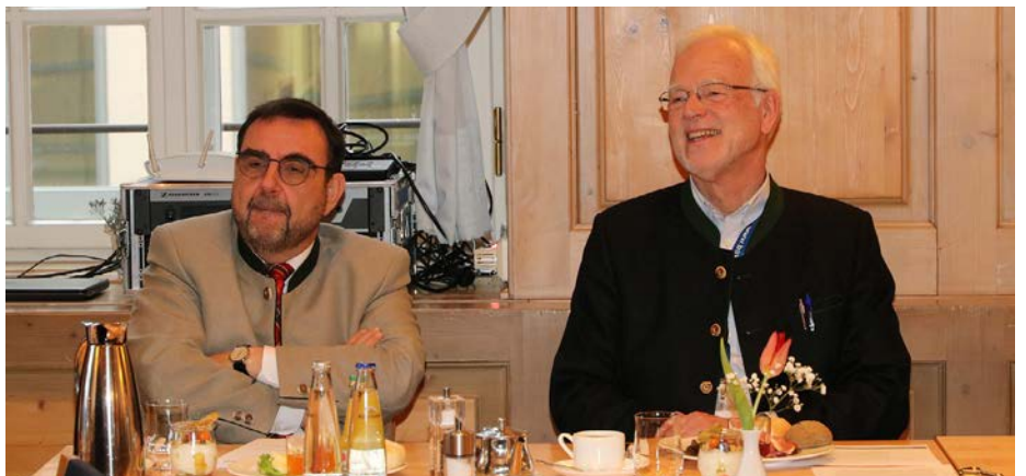
Baylka-Präsident Gebbeken im Austausch mit dem CSU-Fraktionsvorsitzenden Klaus Holetschek.