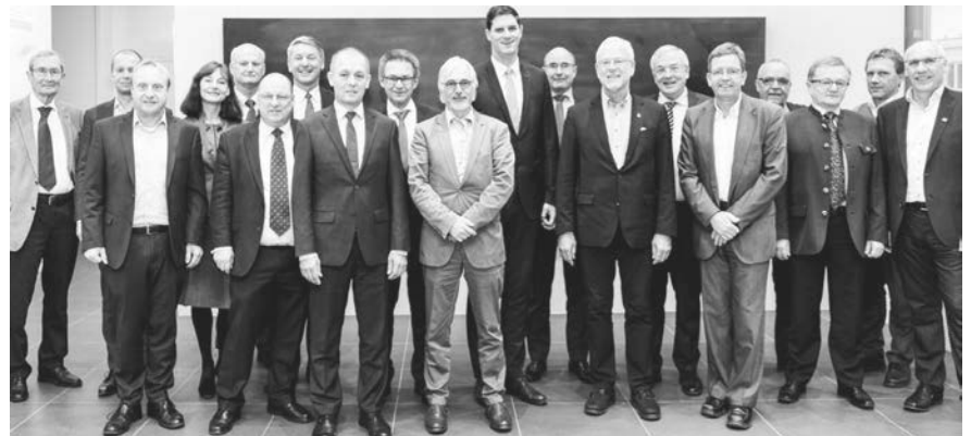
Vertreter der Baylka-Bau und des BBIV vor der Sitzung.

Der sehr offene und konstruktive Austausch bezog sich vorrangig auf das Partnerschaftliche und Verbindende aller am Bau Beteiligten. „Für die Sicherung und Weiterentwicklung unserer modernen Gesellschaft ist ein partner-