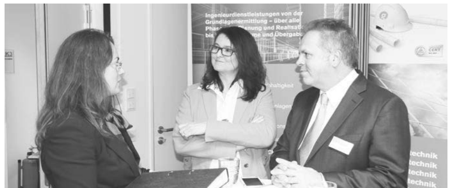
Eine gute Gelegenheit ins Gespräch zu kommen - der Netzwerkabend.

Studierende, Absolventen, Berufseinsteiger oder Erfahrene beziehungsweise auf der Suche nach Werkstudenten, Praktikanten, Bachelor- und Masterab-