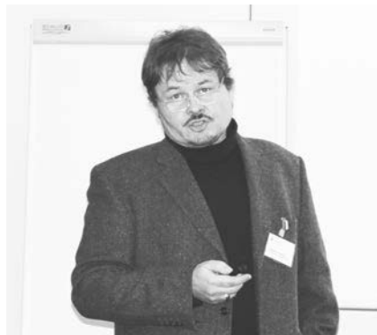
Dipl.-Ing. Univ. C. Dingethal

Um die Teilnehmer über das aktuelle Kammergeschehen zu informieren, sprach Herr Amler zu Beginn des Forums über laufende Projekte, wie die neuen Vorlagen für den Standard-